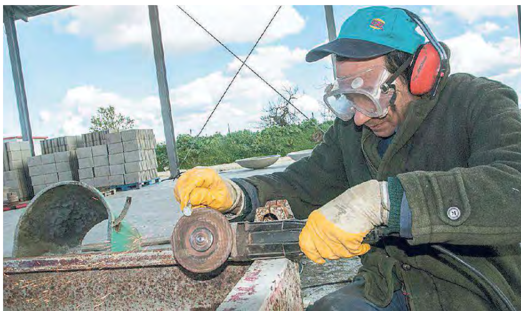
Il settore costruzioni è fra quelli ancora in maggiore sofferenza

Nel report annuale di Cna per la prima volta in sette anni i timidi segnali di una ripresa economica