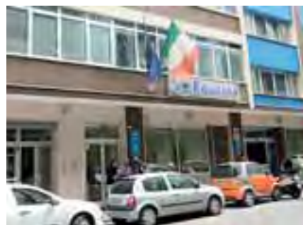
Equitalia a Cagliari

L'obiettivo è quello di servire il maggior numero di cittadini in considerazione dell'alta affluenza che si sta registrando in queste settimane soprattutto da parte di chi vuole aderire alla definizione agevolata che permette ai contribuenti di pagare cartelle e avvisi senza sanzioni e interessi di mora. L'amministratore delegato di Equitalia Ernesto Maria Ruffini ha inviato una lettera a tutti i vertici dirigenzia-