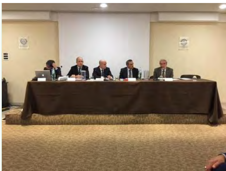
Artigianato: Cna presenta rapporto congiunturale

Presentato rapporto congiunturale, settore sempre in crisi