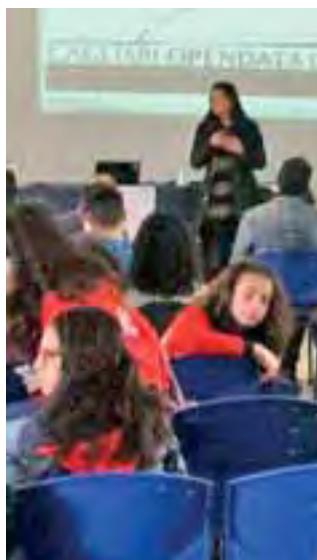
Open data day al Lazzaretto

► Il mondo delle informazioni libere ha incontrato quello della scuola. Ieri anche Cagliari ha celebrato l'International Open Data Day, l'evento dedicato alla condivisione di dati pubblici a beneficio della comunità. Il Lazzaretto ha ospitato per una mattina un centinaio di studenti di scuole superiori e medie, chiamati alla creazione di progetti originali sull'utilizzo di banche dati messe a disposizione gratis e on line da amministrazioni pub-