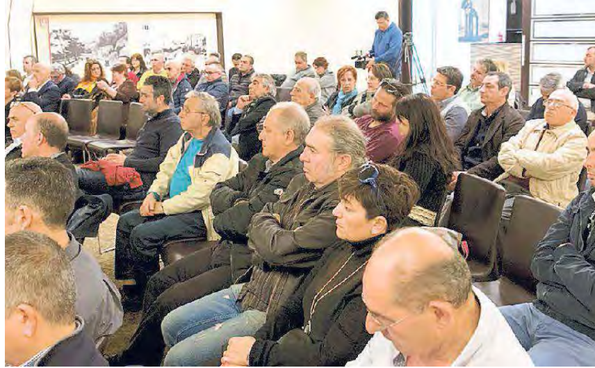
La sala del convegno di Confartigianato

di premialità quasi indipendente dalla realtà delle cose. «Non è pensabile - ha detto il presidente della commissione Bilancio - che indennità di risultato siano assegnate senza obiettivi da raggiungere. La valutazione si basa sul numero delle riunioni, sul numero delle conferenze di servizi cui un dirigente o un funzionario partecipano. Ogni direttore di servizi può dare incarichi cosiddetti di alta professionalità, ma li distribuisce a tutti e a tur-